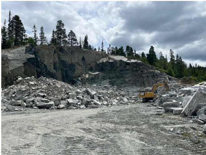
Bilde 2. Bruddet juli 2024.