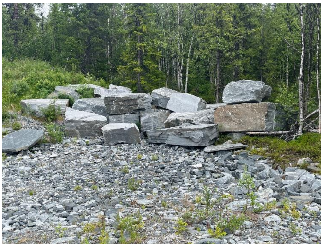
Bilde 3. Eksempler på produkter fra bruddet.