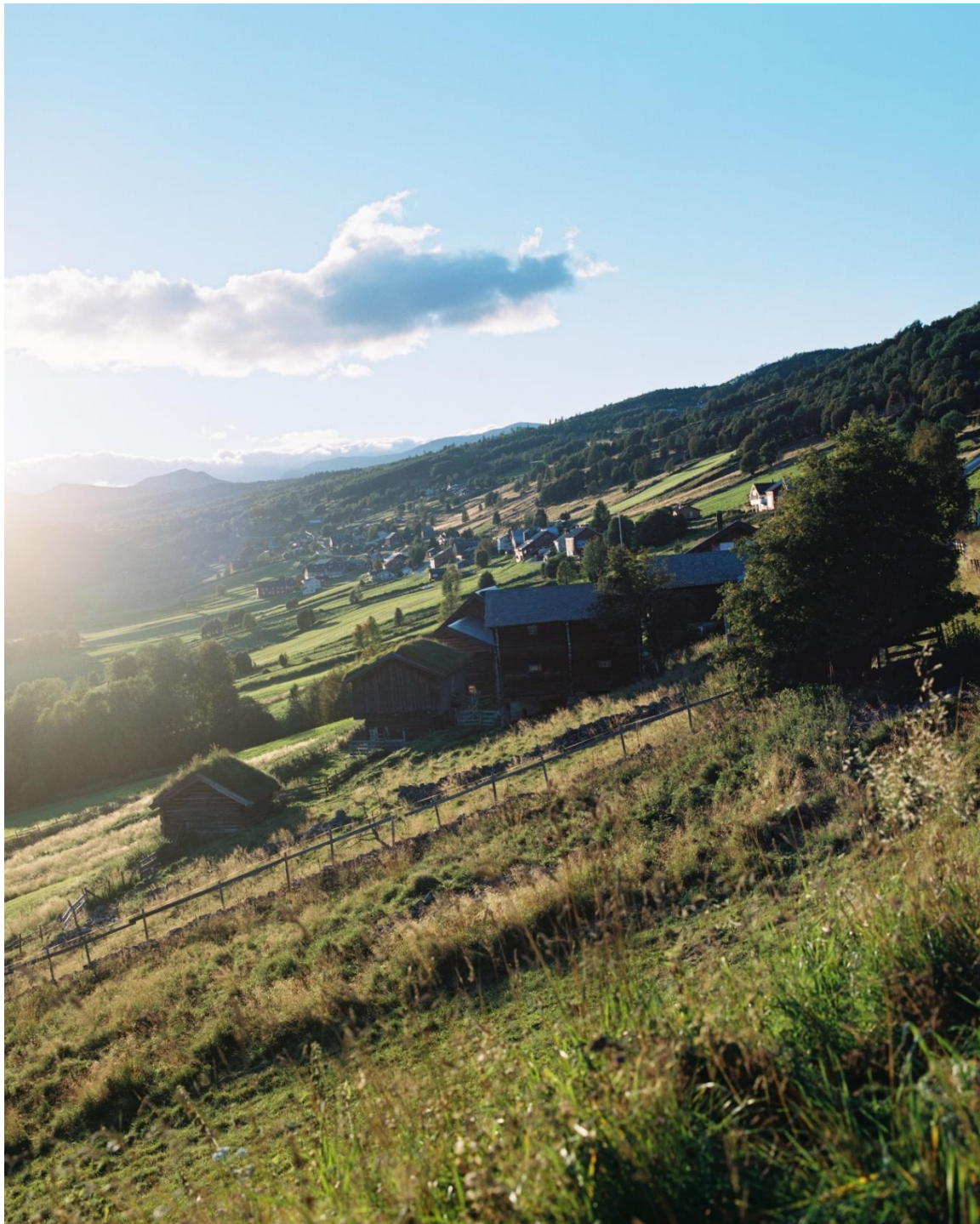
BILDE 1. SIGNE FUGLESTEG LUKSENGARD