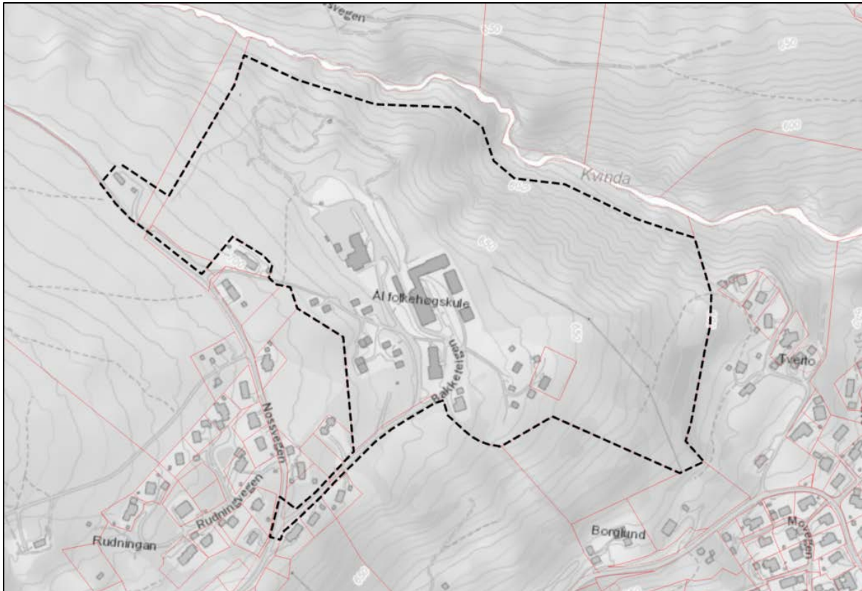
Figur 2: Foreløpig plangrense. I nord er plangrensa trukket utenfor aktsomhetszone for flom langs Kvinda.

Foreløpig plangrense følger eiendomsgrense med unntak av strekningen langs Kvinda der plangrensa er trukket utenfor aktsomhetszone for flom. I tillegg er det foreløpig tatt med tilkomstveier over gnr. 117 bnr. 5, 119/1, 117/31 og 3000/15. Plangrensa kan innskrenkes i løpet av planprosessen.