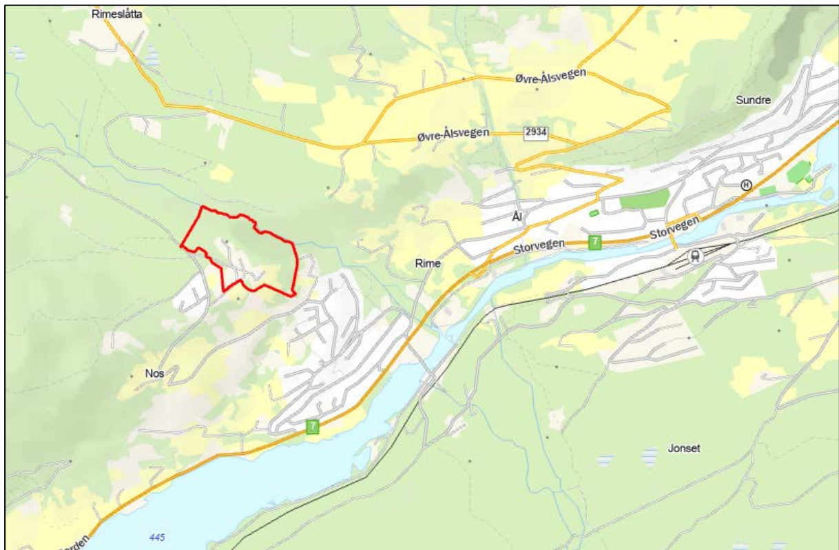
Figur 1: Oversiktskart. Rød linje markerer eiendommens plassering.

Eiendommen som disponeres er på ca. 195 daa og består av 25 bygninger. Den ligger på 670 moh., 5 km fra Ål sentrum/jernbanestasjonen. Området ligger rett nord for boligområdet Granhagen, og tilgrensende bebyggelse er i hovedsak boliger og landbruks- og friluftsområder. Bygningsmassen på eiendommen består av ulike institusjonsbygg (administrasjon, svømmehall, internat, gymsal og utleiehytter/enheter).