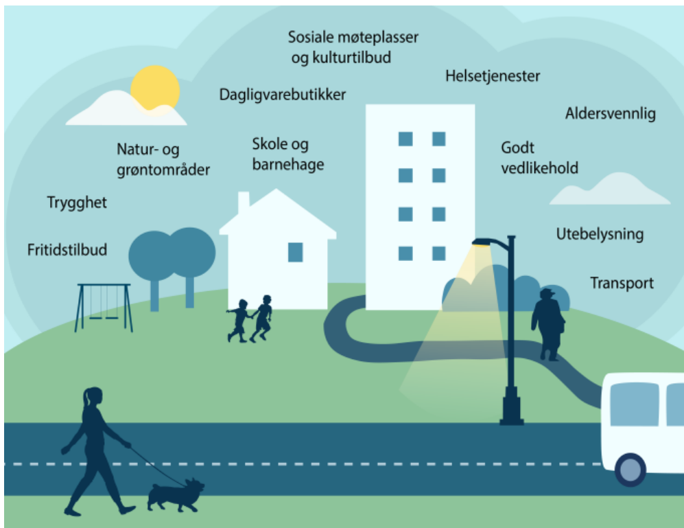
Figur 1 viser nærilmiljøkvalitetar som har betydning for helse og livskvalitet.